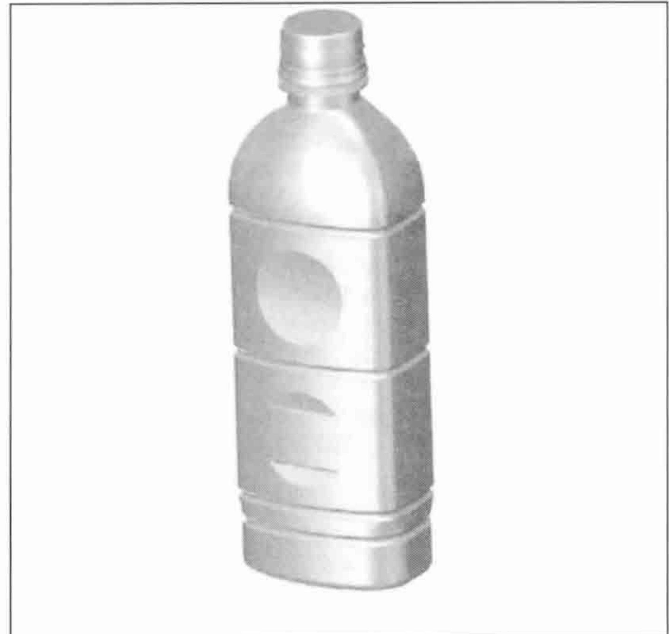
[그림 1] 슬림보틀 형상

에 450ml로 50ml정도의 차이라면 휴대성이 있는 편이 좋다고 하는 의견이 얻어졌다는 점에서 내용량을 450ml로 최종 결정하였다[그림 1].