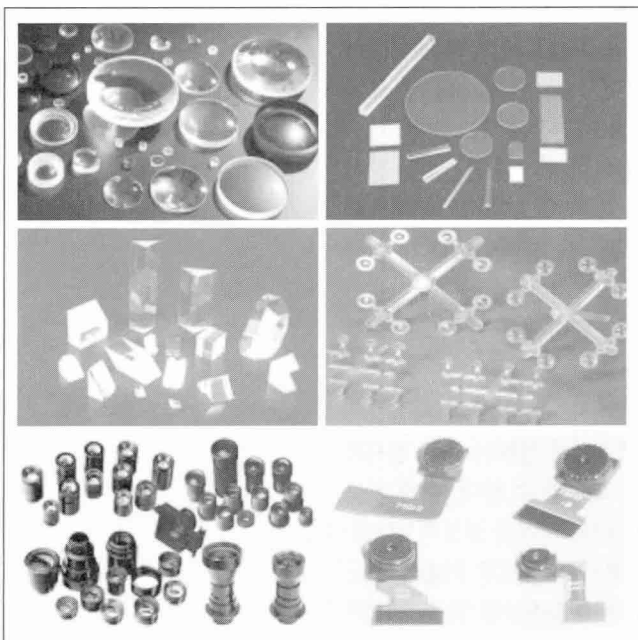
▶ 써니코리아에서 취급하고 있는 제품들

코리아는 국내의 삼성을 비롯하여 일본 광학메이커 회사들과 중국 핸드폰메이커 회사 등에 제품을 공급하고 있다.