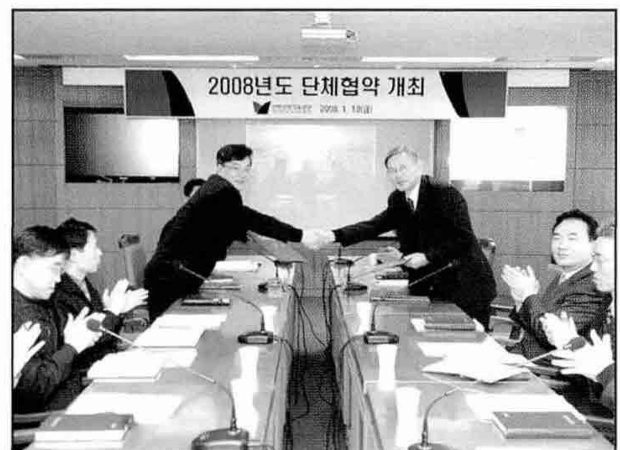
▲ 2008년도 단체협약 개최, 본부 대회의실

한편, 공단은 1988년 노조가 결성된 이래 20년째 무분규 전통을 이어가고 있으며, 선진노사관계 구축으로 공공기관으로서의 사회적 책무를 다하는 등 정부를 비롯한 관계기관·유관단체로부터 노사관계 모범사례로 회자되어 왔다.