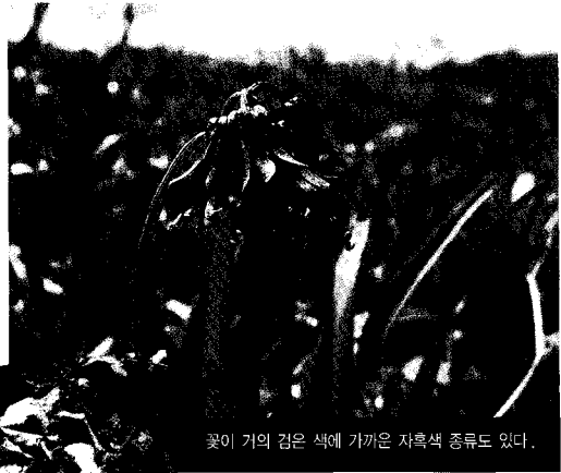
꽃이 거의 검은 색에 가까운 자흑색 종류도 있다.