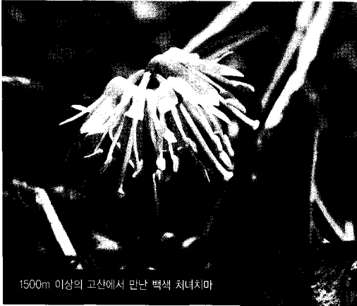
1500m 이상의 고산에서 만난 백색 처녀치마

기르는 데 큰 문제가 되는 병충해는 없으나 고온 다습한 여름철에 뿌리썩음병이나 잿빛곰팡이병 때문에 포기가 죽는 경우가 생긴다. 너무 습하지 않도록 통풍에 유의하고 증상이 보이면 초기에 살균제를 뿌려준다. 🌿