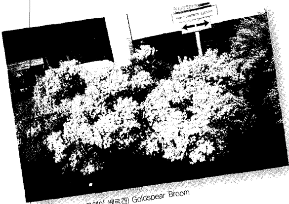
농황색금작화(노르웨이 베르겐) Goldspire Broom