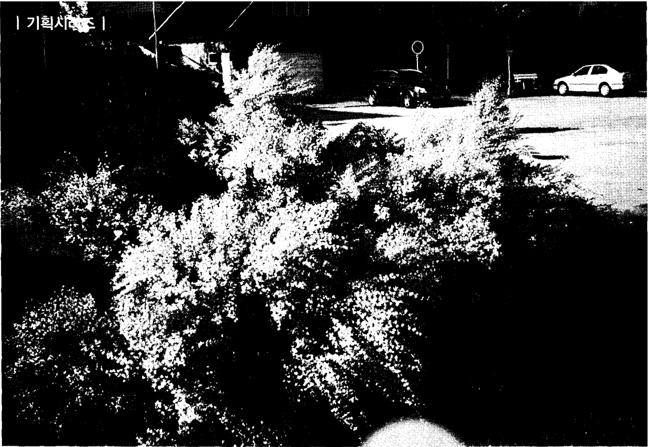
황황색금작화(노르웨이 버르겐) Allgold Broom