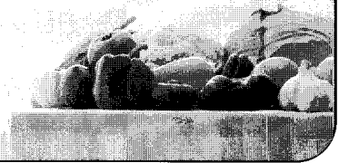
〈자료제공 : 농수산물유통공사 식품산업팀〉