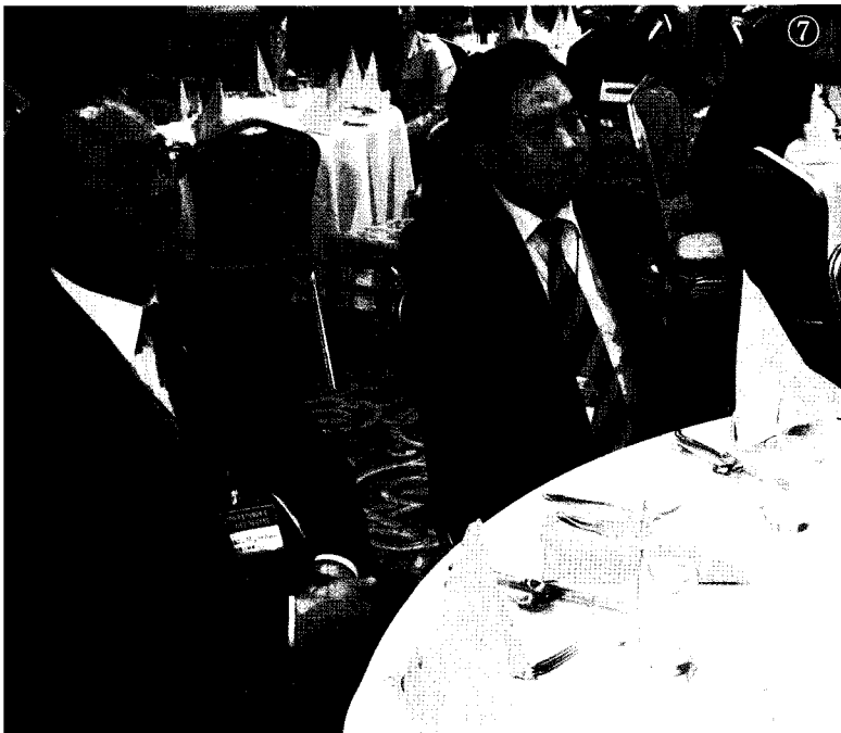
⑦ 창립 35주년을 축하하기 위해 특별히 참석한 일본농약공업회(JCPA) 관계자의 모습이 이채롭다.