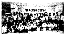
(내리마을 주민과 함께)

많은 비가 내리던 지난 7월 24일(목), 축산과학원(수원 소재)의 자매마을인 경기도 양평군 개군면 내리주민 80여명이 본부를 방문하였다. 소장님 인사말 후 21일 방영된 SBS 드라마 「식객」 중 등급제 판정에 대한 부분을 시청하였다. 그밖에 축산물등급제, 쇠고기이력추적제 대한 홍보영상 시청과 돼지고기 육질등급에 교육이 있었으며, 1층 홍보관에서 계란 횡단 및 투광검사 시연도 이루어졌다.