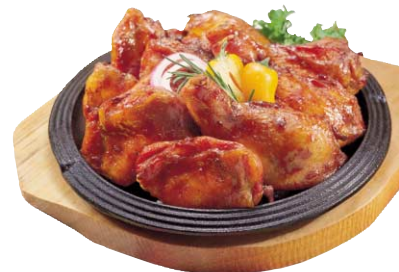
▶ 데리야끼 바비큐