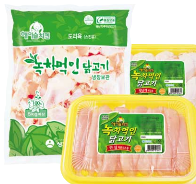
▶ 녹차먹인 닭고기(신선육)