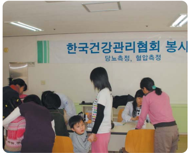
▲ 서울 서부지부는 기초생활수급자 및, 아동복지시설 생활자 등 830여 명에게 무료건강검진을 실시하였다.