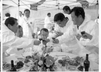
▶ 참관인사들의 오리고기·닭고기 시식

고병원성 조류인플루엔자 발생시 지자체에서 신속·철저한 긴급 방역조치를 수행할 수 있는 초동 대응능력을 배양하기 위해 차단방역, 살처분, 이동통제 등 가상훈련을 10월 27일 충북 청원군 옥산면 호죽리 양계농장에서 장태평 농식품부 장관 및 충북 부지사, 축산단체장, 지자체장과 인근 양계, 오리 농가들이 참관한 가운데 실시하였다.