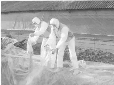
▶ 가금살처분 현장 시연 중 생석회를 도포하는 모습