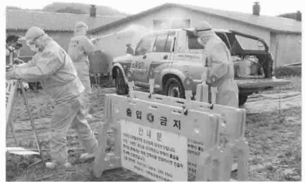
▶ AI 방역 가상 훈련 모습