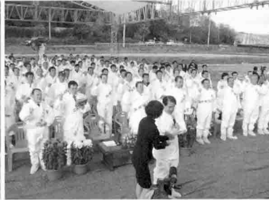
▶ AI 청정국 결의대회 결의문 제창