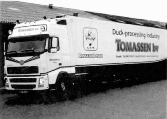
▶ 방콕 랜치는 토마센의 배급시스템을 통해 EC시장에 공급되고 있다.

칸디나비아와 다른 지역 사이의 여러 국가들)로의 배급에 대한 책임을 인계 받았다.