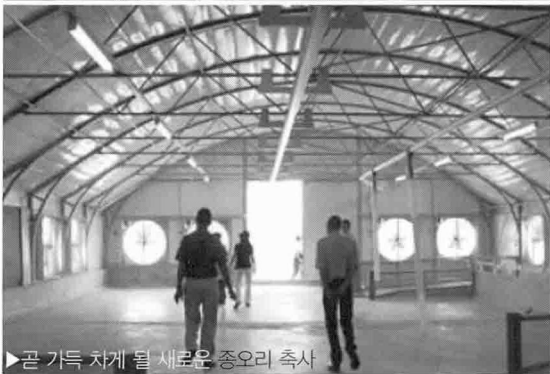
▶ 곧 가득 차게 될 새로운 종오리 축사