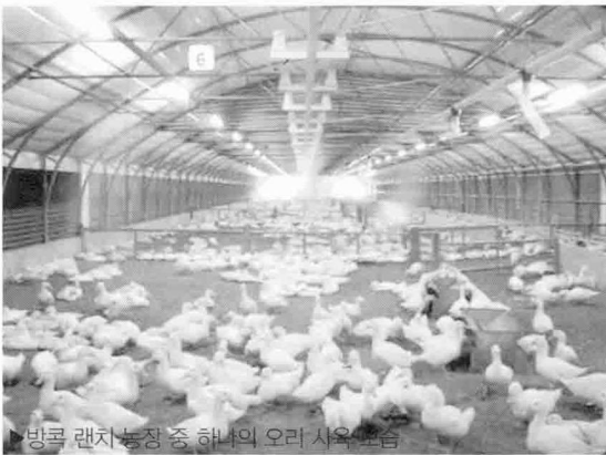
▶ 방콕 랜치 농장 중 하나의 오리 사육 모습

오늘날의 방콕 랜치(Bangkok Ranch)는 슈 일가에 의해 1980년대 초반에 설립돼, 빠르게 성장하고 있는 태국의 오리산업에서 주요 역할을 하는 회사 중 하나로 2007년에만 약 175만수의 오리를 생산하면서 설립 초반의 명성을 회복하였다.