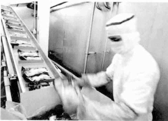
▶ 대부분의 생산물은 냉동과 조리 공정을 거쳐 출하되고 있다.