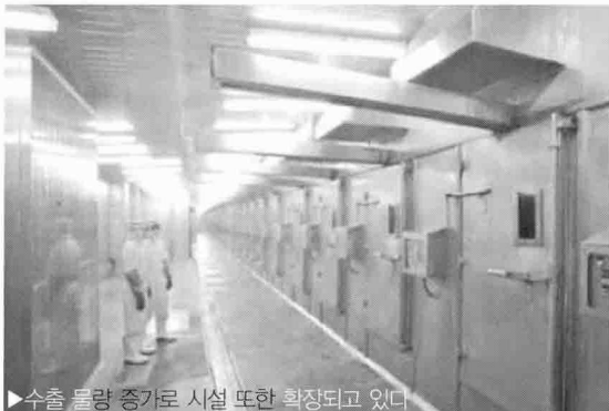
▶ 수출 물량 증가로 시설 또한 확장되고 있다