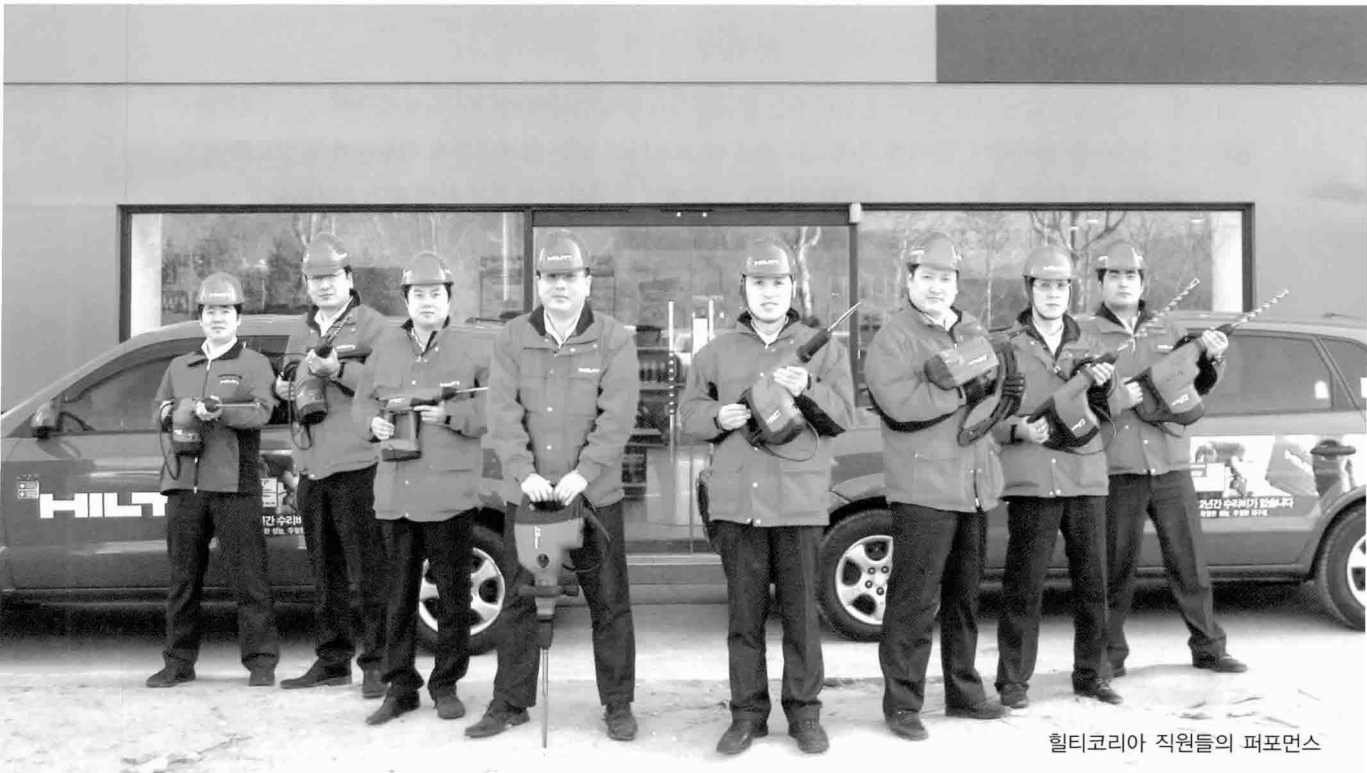
힐티코리아 직원들의 퍼포먼스