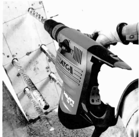
▲ TE70-ATC 해머드릴링 작업

힐티 전동공구의 탁월함은 공구를 개발할 때 성능이나 내구성뿐만이 아니라 사용자의 안전과 건강을 고려한다는 것입니다. 건설현장에서 대부분의 근로자들은 콘크리트 등의 모체에 해머드릴 작업 시 갑작스런 토크의 증가로 인하여 공구가 헛돌아 작업자의 손목, 발목 등을 크게 다치는 경우가 자주 발생합니다. 힐티는 이러한 경우를 고려하여 ATC(Active Torque Control)라고 하는 시스템을