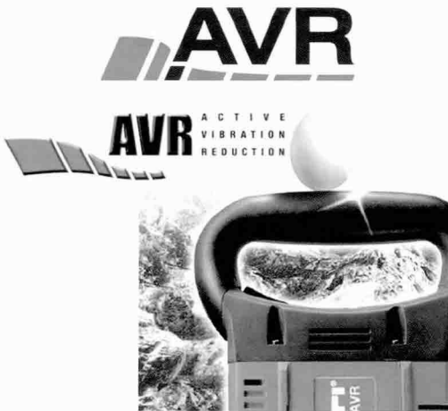
▲ AVR(Active Vibration Reduction)