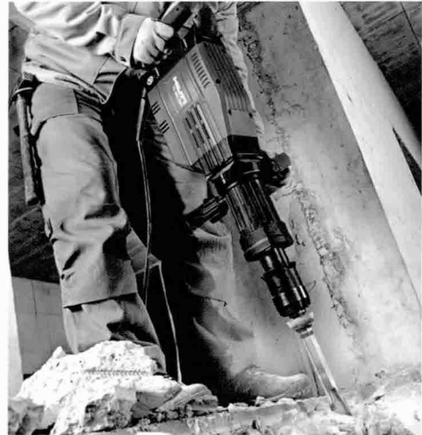
▲ TE909-AVR 바닥 철거 작업

건설 현장에서의 작업자 건강과 안전을 생각한 또 하나의 기술이 힐티 브레이커에 적용되어 있습니다. TE 905-AVR 은 10kg 이상의 무게를 가진 전동 브레이커로서 콘크리트 바닥 파쇄 전문 공구입니다. 무게 및 파워가 높기 때문에 작업자에게 그 만큼의 심한 진동과 피로감을 줄 수 있습니다. 짧은 시간의 작업에도 손목 부위뿐 만이 아니라 팔 및 몸 전체가 저린 경우가 대부분이고 심한 경우에는 작업 후에 밥을 먹기 힘들 정도입니다. 힐티의 AVR(Active Vibration Reduction) 시스템은 이러한 문제를 해결하는 혁신적인 기술입니다. 진동이 50% 이상 감소되어 피로감이 훨씬 덜하고 작업 편이성이 증대되어 숙련된 작업자가 아니더라도 같은 성능의 브레이커 작업을 가능하게 합니다.