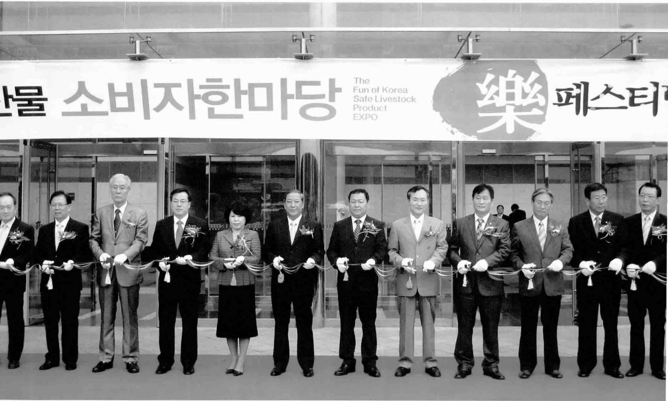
행사에 참석한 단체장들이 행사 개막을 알리는 테이프 커팅을 하고 있다.