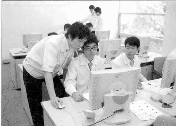
▶ 교육생이 사무실 네트워크 시스템에 대한 교육을 받고 있다.