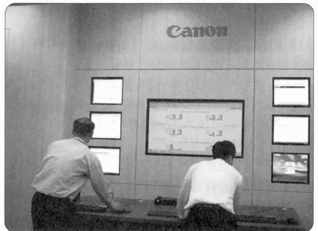
▶ 중앙 전산실을 통해 각 지사의 복합기에 대한 모든 사항을 실시간으로 점검할 수 있는 시스템을 갖추고 있다.

한편, 캐논코리아비즈니스솔루션은 지난 1985년 롯데그룹과 일본의 캐논이 합작 설립한 (주)롯데캐논을 전신으로 하는 디지털입출력 통합솔루션 전문기업으로 지난 2006년 3월 현재의 사명으로 변경했다.