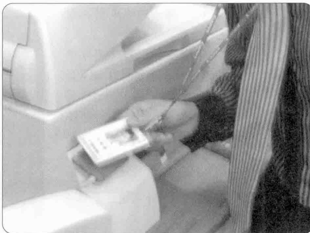
▶ 캐논코리아의 솔루션복합기는 IC카드만 대면 보안인증이 되어 기업 정보 유출을 방지할 수 있다.