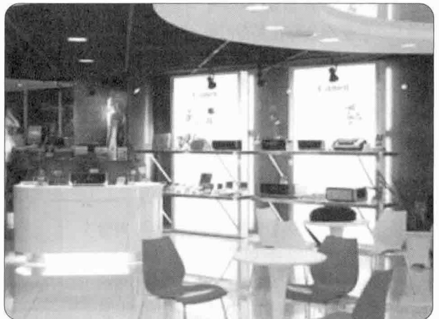
▶ 지하 1층에는 일반 소비자용 제품들이 전시돼 있다.