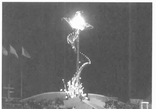
지에스티 LED응용제품인 성화대를 제작하여 광주와 창원 월드컵경기장에 설치