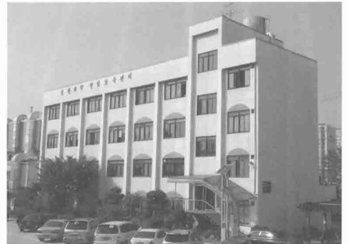
송원대학 창업보육센터 전경

윤 센터장은 광주지역 역점사업인 광산업 및 디지털 콘텐츠 산업의 매출 증대와 고용 확대에 기여하기 위하여 광 관련 입주업체들에게도 기술 지원 및 마케팅 지원을 아끼지 않고 협조하여 지역 경제를 활성화 하는데 조금이나마 보탬이 될 수 있도록 노력하겠다고 말했다.