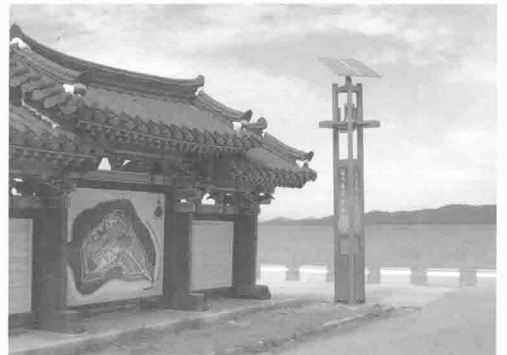
디디솔라테크 태양광 응용제품 설치