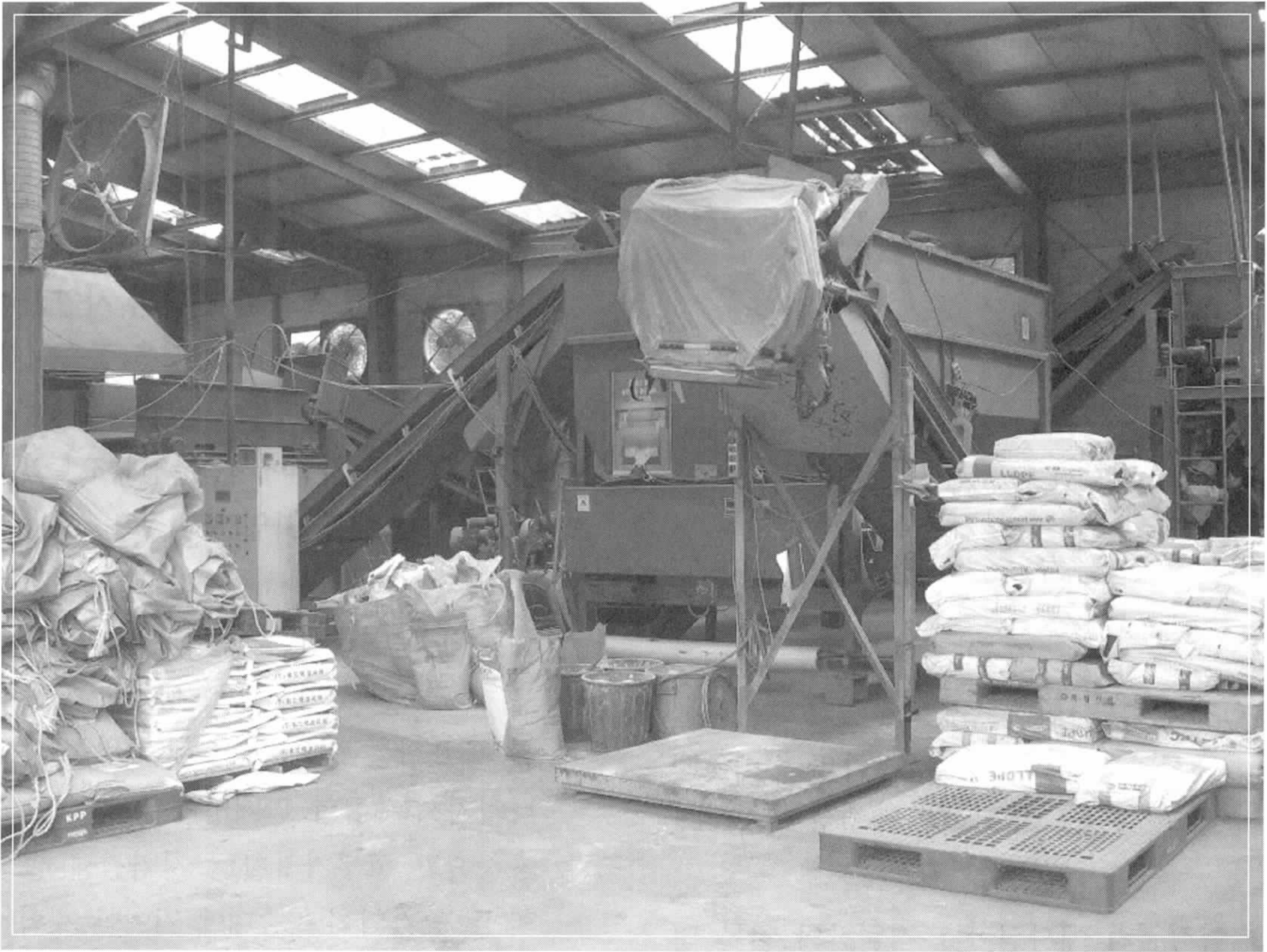
↑ 사료공장 내부 전경

그리고 나머지는 정부가 해야 할 일인데, 물론 정부도 많은 노력을 하고 있는 것으로 알고 있습니다만, 특히 제도개선을 통해 원가를 줄일 수 있도록 해야 합니다. 예를 들면 사료원료의 무세화라든지 할 수 있는 것부터 하나하나 추진해나아가야 하겠습니다. 해외자원개발에도 적극적인 지원이 필요합니다.