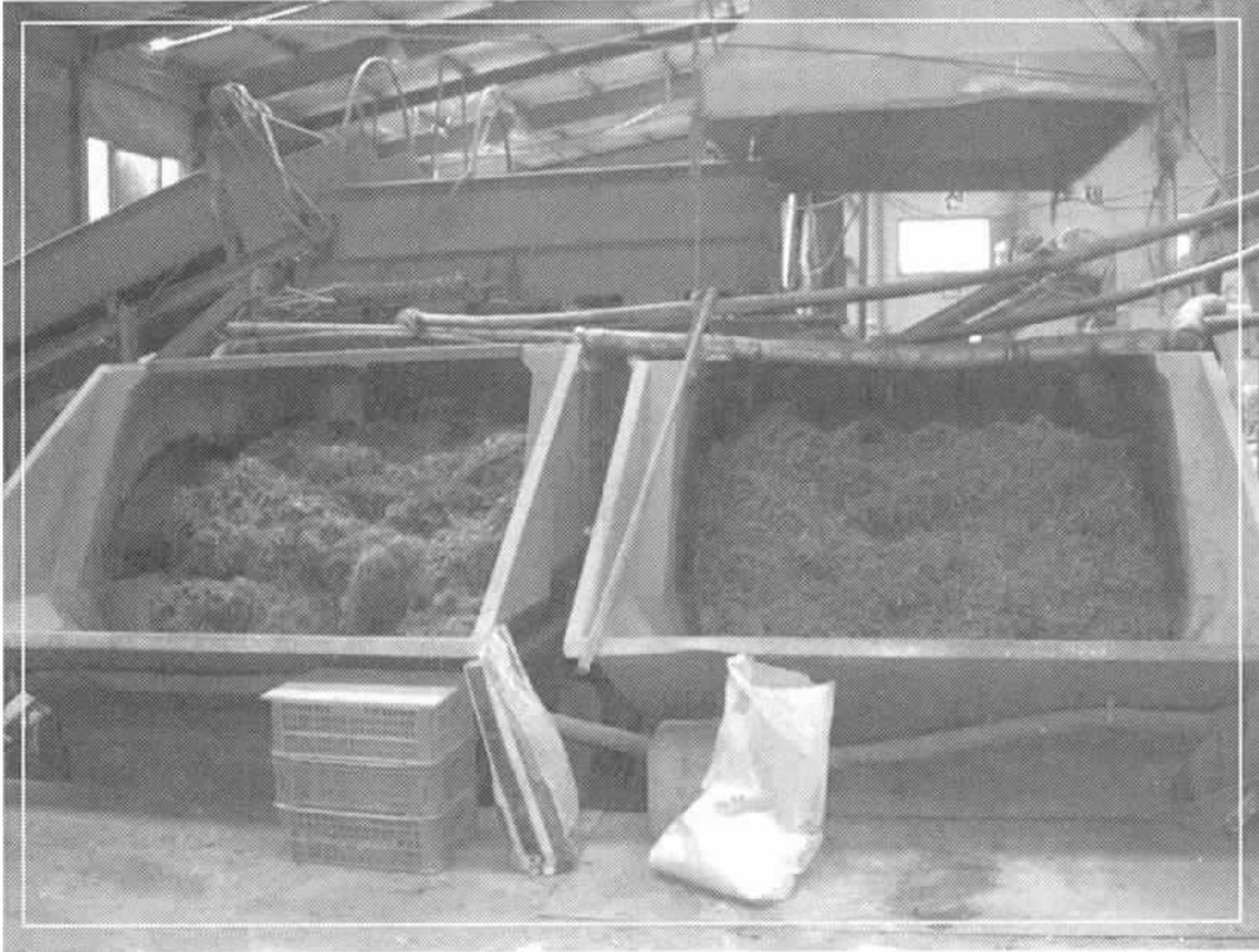
↑ TMR사료 제조과정