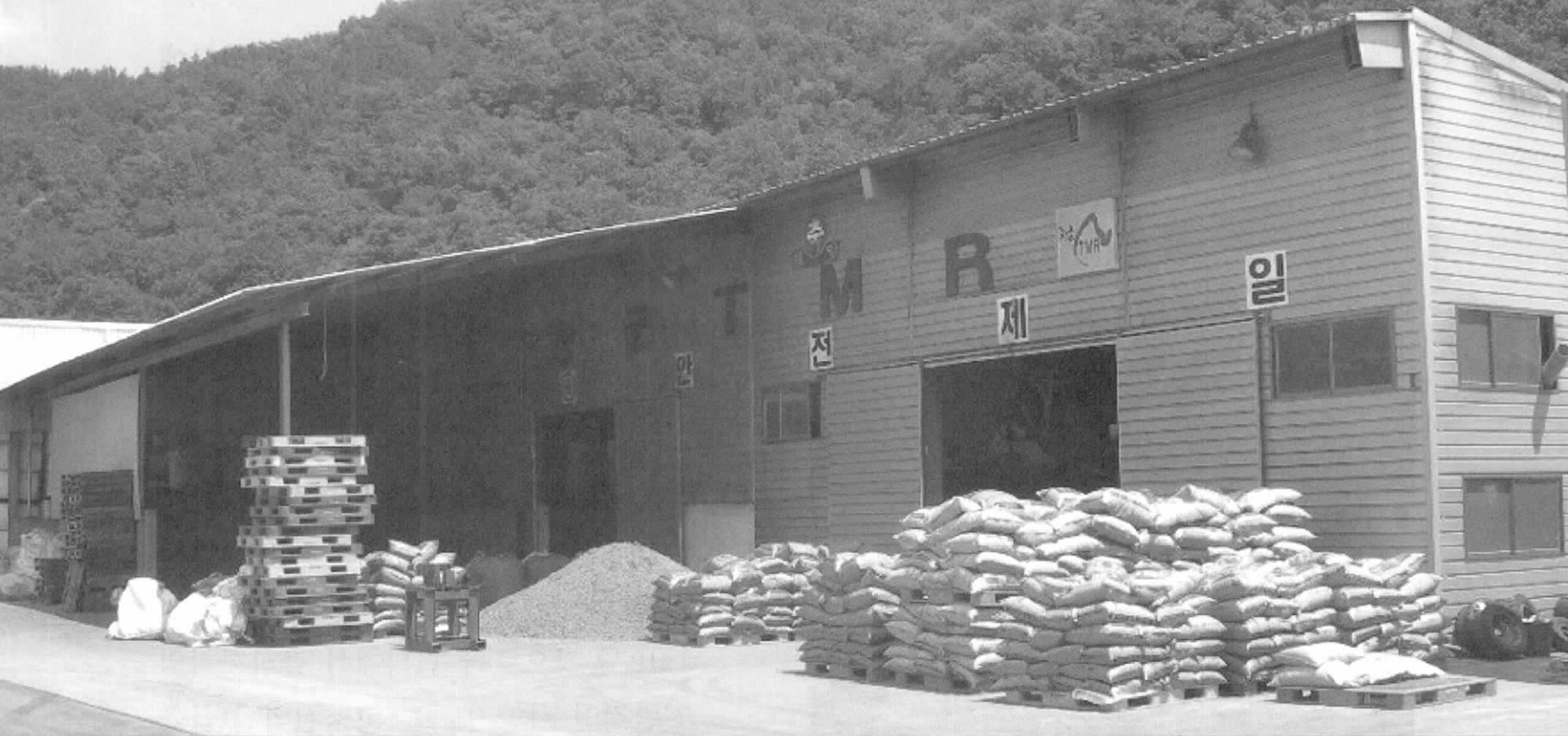
▲ 장군산 TMR 공장 전경