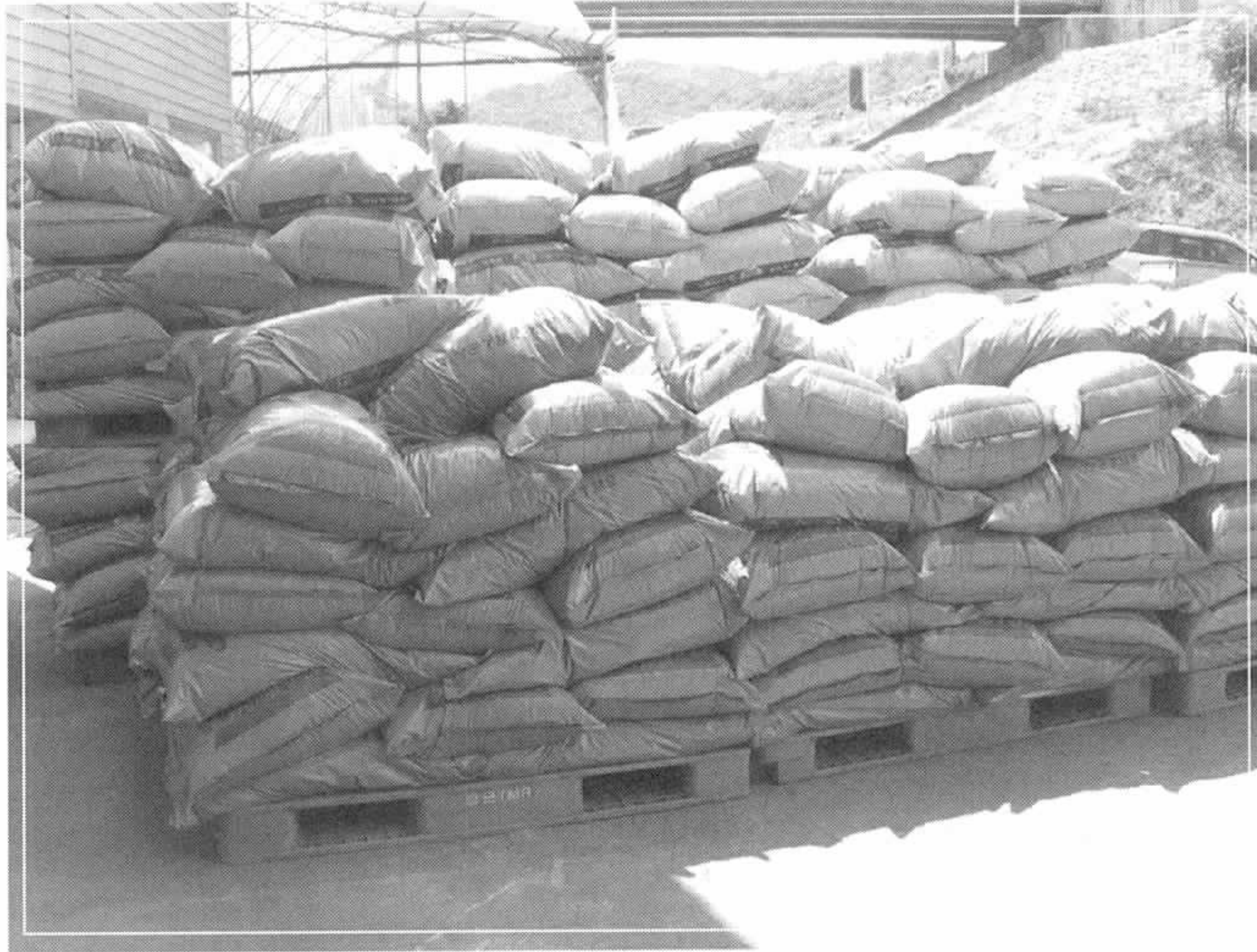
↑ 출고를 앞두고 있는 완제품들

제조·공급함으로써 고품질의 고급육을 생산하는데 기여하며, 농가의 수익증대를 위해 혼신의 노력을 다하고 있습니다.