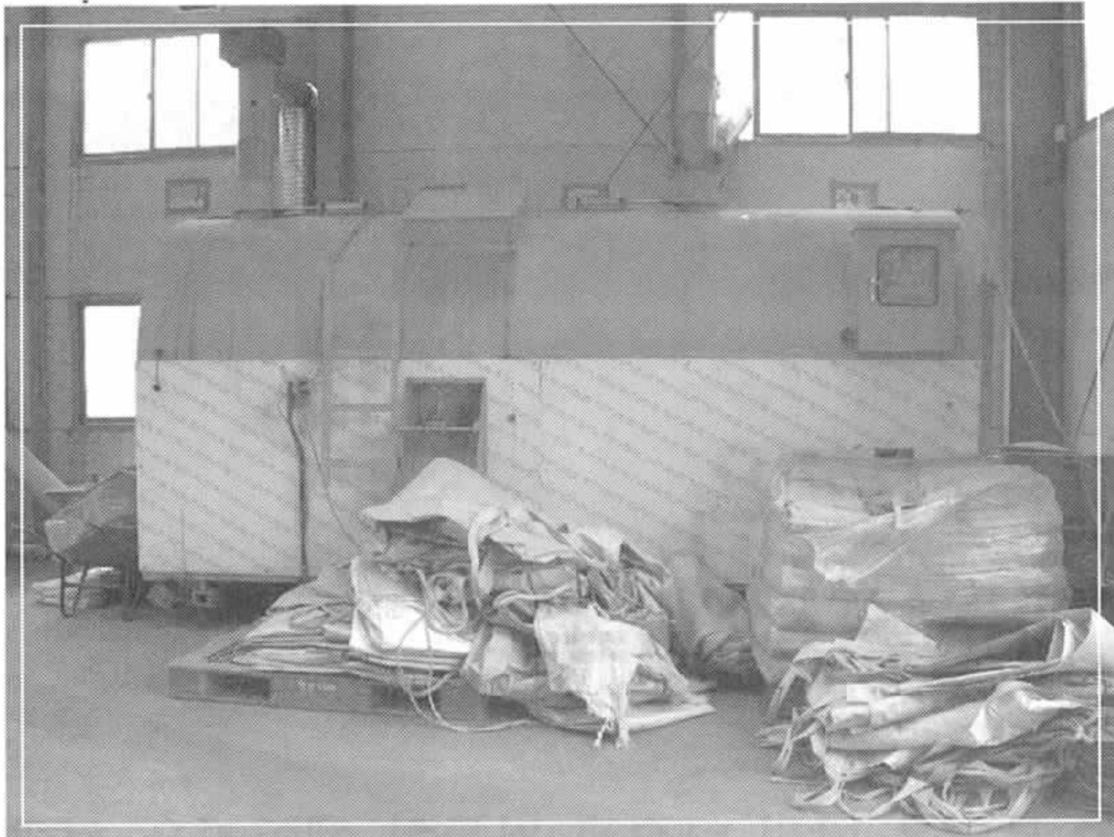
↑ 미생물발효기(직접 미생물을 배양하여 사료에 첨가한다.)