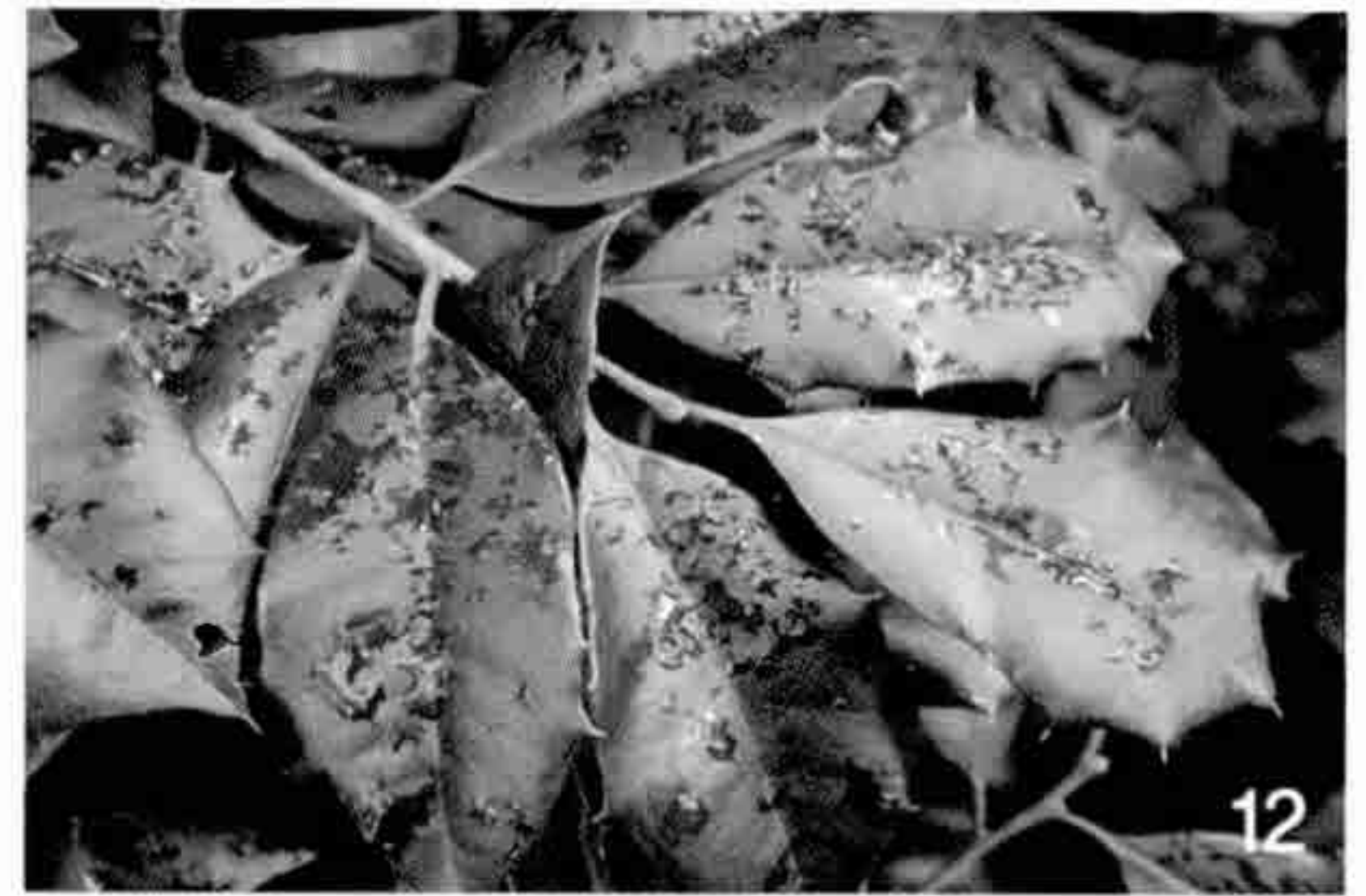
10. Ilex opaca 'Satyr Hill' (전체수형) 10-1. Ilex opaca 'Satyr Hill' (잎과 열매) 11. Ilex opaca 'St. John's' (잎과 열매) 12. Ilex opaca 'Villanova' (잎)