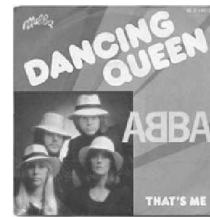
ISWC 코드: T-000000001-0

1996년 스웨덴 그룹 Abba의 〈Dancing Queen〉의 최초 부여로부터 2004년 말까지 1300만개 이상의 ISWC 번호가 부여되었다.