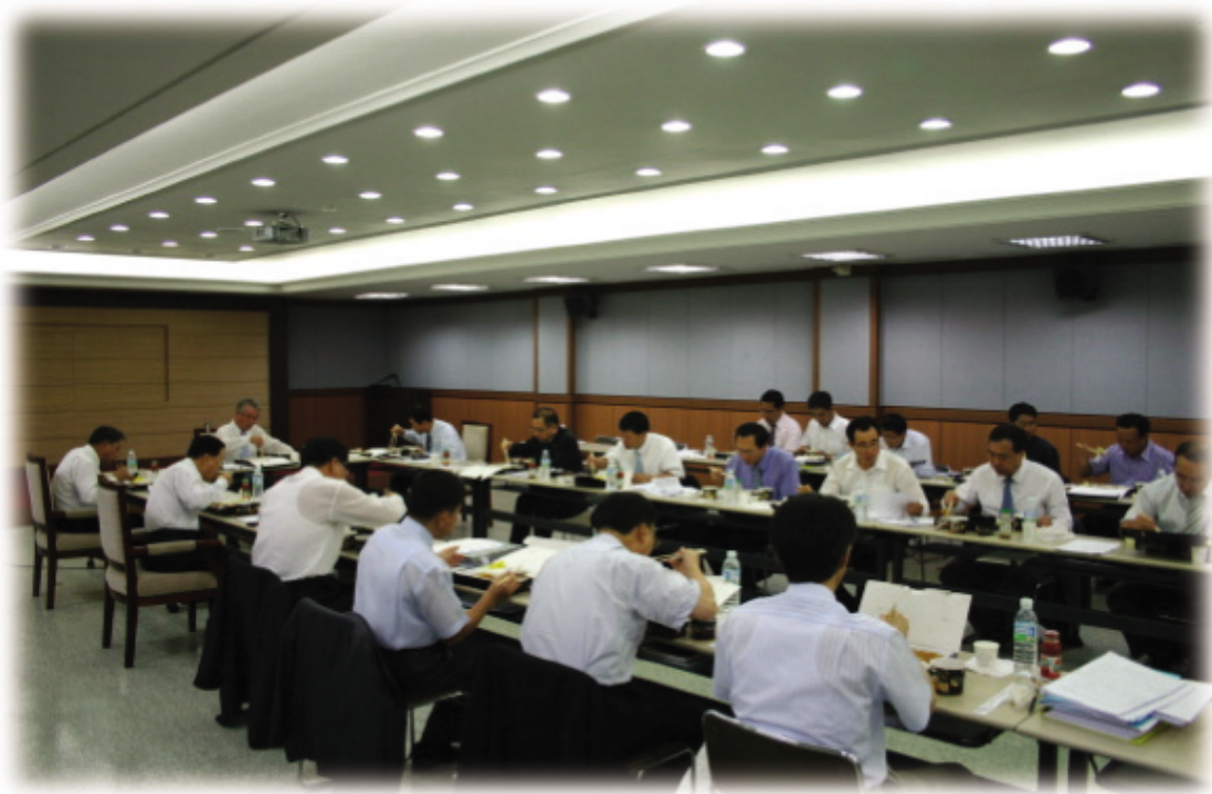
▲ 효율적인 회의 진행과 토론을 위하여 점심식사 중에도 회의 진행 모습