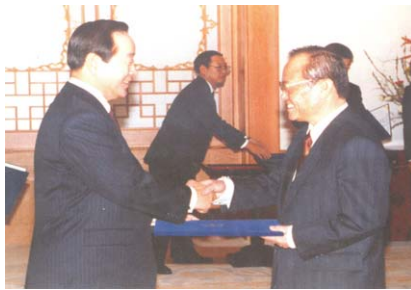
1993년 김영삼대통령으로부터 과학기술처장관 임명장을 받고 있는 모습