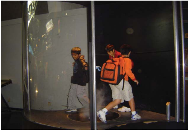
익스플로러토orium을 방문하는 학생들을 위해 교사들은 전시물의 원리를 과학관에서 미리 교육받고 지도한다.