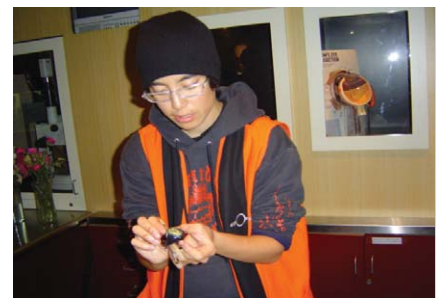
일정한 시간마다 소의 눈을 해부해 보여주는 익스플레이너. 익스플레이너는 전시물을 관람객에게 설명하거나 시범실험을 보여주는 아르바이트 학생들이다.

해외과학관의 매력에 푹 빠져있던 필자로서는 부러울 것 없어 보이던 친구가 "나 돈 좀 꾸어줄래?"하는 소리를 듣는 심정이었다. 그래서인지 그 뒤로는 과학관의 경영이 얼마나 중요한지 골똘히 생각하게 됐다. 아주 단순하게 생각해보면 과학관의 수입은 관람객의 입장료로 생각할 수 있다. 하지만 세계 어느 과학관도 입장료 수입만으로 과학관을 운영하기는 역부족이다. 규모가 큰 과학관일수록 사태는 더 심각하다. 1년 예산이 120억 원 정도인 호주 국립과학기술센터(퀘스타콘)의 경우 입장료 수입이 전체 예산의 28%를 차지해 비교적 좋은 편이다. 예산이 690억 원 정도인 뮌헨의 도이체스 박물관은 입장료 수입이 13%, 예산이 300억 원 정도인 일본 과학미래관은 10%를 차지한다. 이것만 보더라도 입장료 수입으로 과학관을 운영하기에는 거의 불가능하다는 사