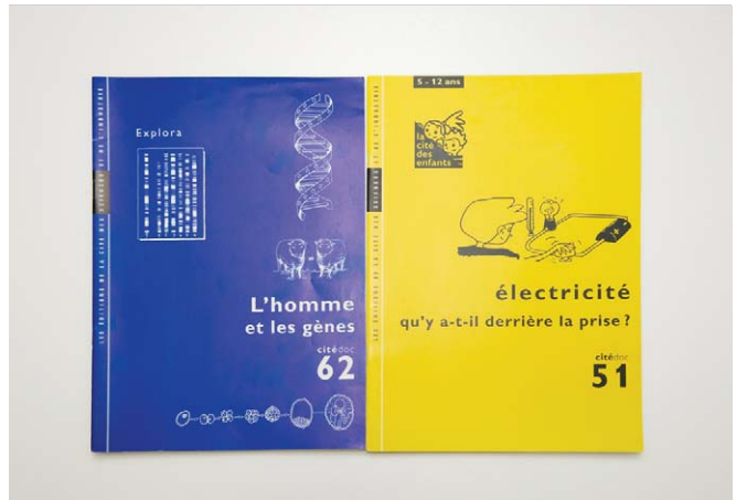
라빌레테에서 만든 전시물 관련 활동지, 대상 연령과 주제에 따라 매우 다양하다.