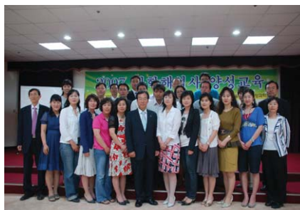
2007 과학해설사 양성교육 전문가 과정 수료식

외국과 비교하여 과거 과학기술부가 수립한 2003년 과학관육성 기본계획 당시의 과학관 수는 56개로 집계된 바 있다. 이후 '과학관육성을 위한 실태조사 및 수익모델 개발(2005)'에 따르면 과학관은 그 설립주체에 따라 국립과 공립, 사립으로 구분되고, 2005년 국립과학관 9개, 각 시·도 과학교육원을 비롯한 공립과학관이 44개, 사립과학관이 34개로 총 87개의 과학관이 있다. 여기에 각 대학 부설 자연사박물관 등을 포함시키면 총 97개의 과학관이 설립·운영되고 있다. 2005년 통계청 인구주택조사 자료를 고려할 경우 약 46만명당 한 개의 과학관이 운영되고 있는 실정이다. 그러나 최근 국내 과학관은 전국과학관협회에 등록된 기관을 포함하여 100개에 이르고 박물관이면서 과학적 전시물을 소유하거나 기능이 있는 자연사 박물관들을 과학관의 범주에 포함시킬 경우 그 수