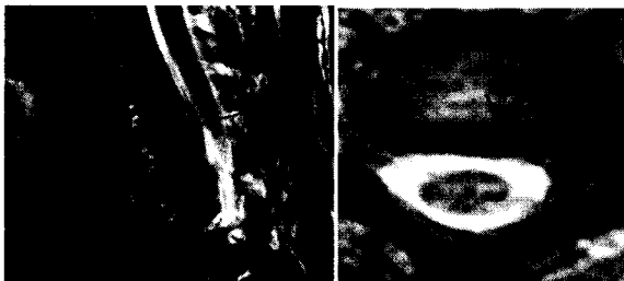
Fig. 3. Sagittal and axial C-spine MRI(level C6/7)

2007년 12월 06월 C-spine MRI상 HCD C6/7 extrusion Lt. 진단을 받았다(Fig. 3).