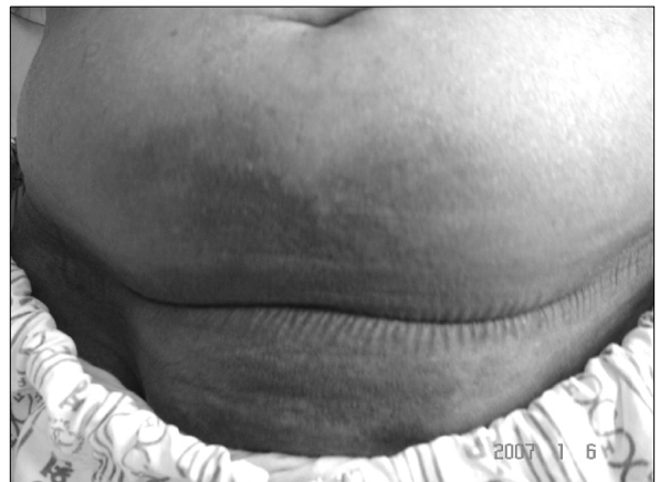
Figure 2. This photograph shows extensive bruise on the lower abdomen of the patient.

치료 및 경과: 기관지확장제 흡입치료와 moxifloxacin 을 투여하였고 이노제를 증량하였다. 치료 시작 후 호흡 곤란과 양측 하지 부종은 다소 호전되었으나 기침은 계속 되었다. 내원 14일째 하복부 통증을 호소하기 시작하였고 복부 팽만과 압통이 관찰되었다. 당시 활력 징후는 혈압