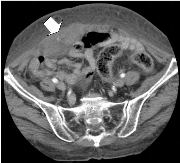
Figure 3. Abdominal computed tomography performed 2 weeks later shows rectus sheath hematoma decreased in size (5.2×2.8 cm).

기 위해 골반 자기공명영상을 시행하였고 전산화단층촬영에서와 마찬가지로 우측 복직근과 하부 복강에서 혈종에 합당한 소견이 관찰되었다. 혈종의 크기가 커서 수술을 고려하였으나 복부 통증이 경감되고 하복부 멍의 크기도 점차 감소하여 혈색소 수치를 추적검사하며 경과를 관찰하였다. 28병일째 하복부 멍의 크기는 많이 줄었고 통증과 압통 소견도 관찰되지 않았다. 추적검사로 시행한 복부 전산화단층촬영에서 우측 복직근초 혈종의 크기는 감소하였다(Figure 3). 외과린 투여만 중지한 채 경과를 관찰하기로 하고 31병일째 퇴원하였다. 퇴원 후 8일째부터 외과린을 다시 투여하기 시작하였고 특별한 문제없이 통원 치료중이다.