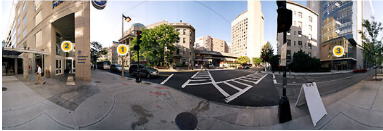
Figure 3. 현재 Children's Hospital 정문 입구에서 바라본 파노라마 사진으로 ①번 건물이 Figure 1에서 보았던 Hunnewell Building의 현재 모습이고, ③은 최첨단 연구동인 Karp Building이다.