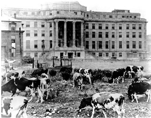
Figure 1. 1914년에 문을 연 Children's Hospital Boston의 Hunnewell Building. 건물 앞에 보이는 젖소들을 병원에서 사육하여 tuberculosis-free milk를 어린 환자들에게 공급하였다 한다.