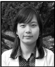
2008년 경희대학교 환경공학과 공학사

현재 서울대학교 에너지시스템공학부 석사과정 (E-mail : nalyj84@snu.ac.kr)