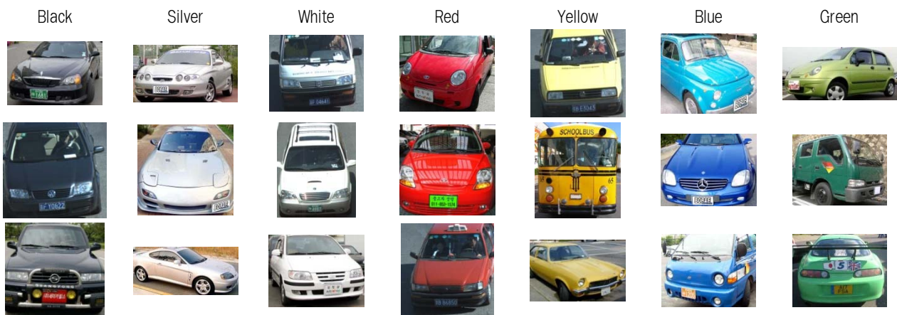
(그림 1) 색상 인식에 사용되는 영상의 예

본 논문에서는 특징 벡터의 차원이 너무 커지지 않도록, 3차원 색상 공간을 2차원 색상 평면으로 투사하여 2차원의 히스토그램을 생성함으로써 입력 영상에 대한 특징 벡터를 구성하고자 한다. H, S, I의 각 성분 값의 범위를 16개의 구간으로 양자화하여 각 성분 값이 0과 15 사이의 정수로 표현된다고 가정한다. H, S, I 각 성분을 16개의 구간으로 나누어서 H와 S에 대한 히스토그램( histo^{HS} ), H와 I에 대한 히스토그램( histo^{HI} ), 그리고 S와 I에 대한 히스토그램( histo^{SI} )