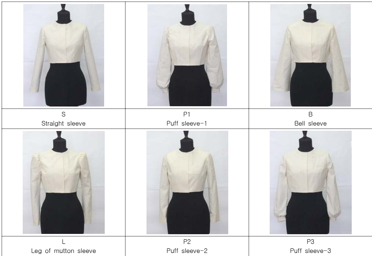
[그림 1] Set-in Sleeve 형태