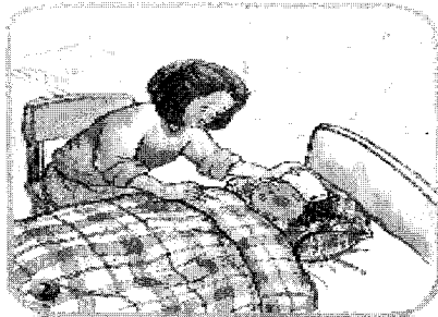
그림 13. 아픈 자녀를 돌보는 어머니 (도덕1, 66쪽)