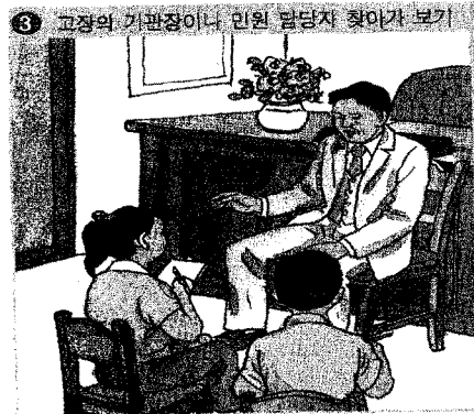
그림 18. 교장의 기관장=남자 (사회4-1, 121쪽)

또한 우리나라 역사 속의 주요 인물로 남자는 석주명, 김만중, 박제상, 조식, 김구, 정약용, 장기려, 안창호, 이홍근, 남궁억, 안익태, 장보고, 단군, 온조, 왕건, 강감찬, 조현, 서희, 장지연, 김옥균, 홍선대원군, 지석영, 의천, 이성계, 세조, 세종, 이순신, 김옥균, 최계우, 김홍집, 서재필, 고종, 최익현, 민영환, 이승호, 안중근, 박은식, 주시경, 이봉창, 윤봉길 등 40 여명이 등장하는 반면, 여자는 유관순 한 명만 제시되었다.