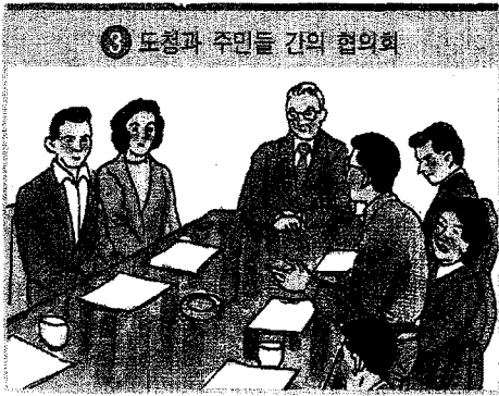
그림 17. 도청의 기관장=남자 (사4-1, 112쪽)