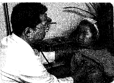
그림 15. 의사=남자 (과학3-2, 85쪽)