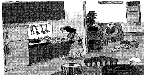
그림 12. 대화하는 가족과 설거지하는 어머니 (과학4, 96쪽)

그리고 다음 그림에서와 같이 남자는 경제 활동을 하는 주체, 정치를 이끌어 가는 사람, 의료 행위의 주체 등으로 그려지는 반면, 여자는 집에서 아이를 양육하는 사람, 간호사와 같이 의료 행위의 보조자로 묘사되고 있어서 성 역할과 사회적 지위에 있어서 남자를 비교 우위로 표현한 점은 양성 평등적 관점에서 볼 때 성 역할과 지위에 대해 학생들에게 편견을 가지게 할 우려가 있다고 판단된다.