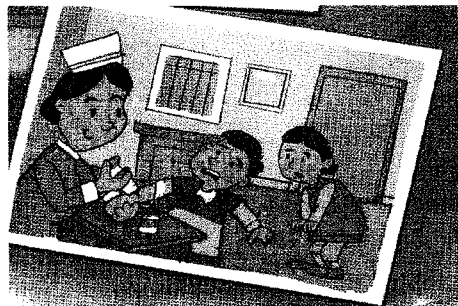
그림 16. 간호사=여자 (사회3-1, 55쪽)