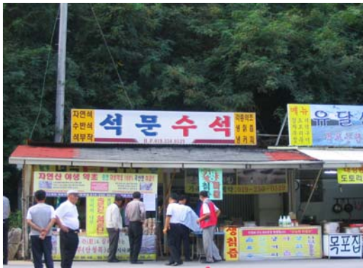
[사진 2] 고수동굴 방문 단체관광객(일반)