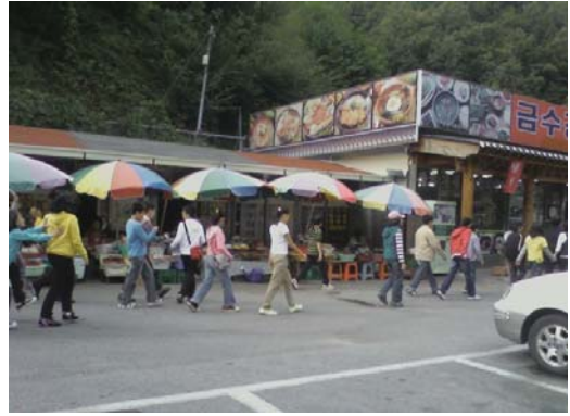
[사진 3] 고수동굴 방문 단체관광객(학생)