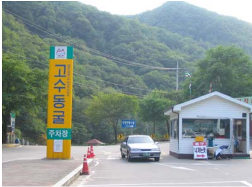
[사진 1] 고수동굴 입구 주차장

물에는 장님엽새우, 염주다슬기, 물고 기 등 약 25종이 서식하고 있으며, 사자바위, 문어바위, 독수리바위, 마리아상 등 120여개의鍾유석과 석순이 웅장하게 들어서서 모양새를 갖추고 있다(www.knto.go.kr).