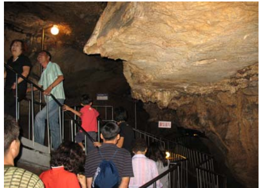
[사진 3] 고수동굴 내부의 관광객