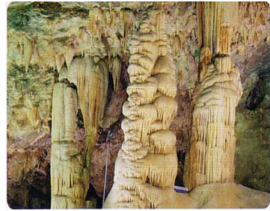
그림 1. '대자연의 신비'의 석순과 석주

첫째 ‘역사의 장’으로서 천포광산 개발 당시의 모습을 재현하여 광산 개발의 전과정과 작업의 어려움을 살펴볼 수 있게 했는데, 특히 직접 굴착기를 이용하여 채굴과정을 체험할 수 있게 하였으며 대형 현미경을 통해 이 지역에 형성된 금광맥을 관찰할 수 있다(<그림 2> 참조).