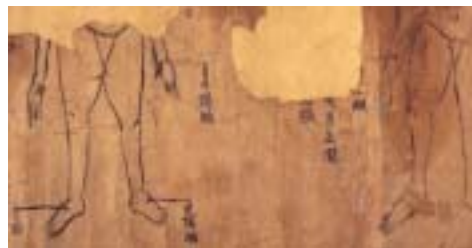
그림 3. 敦煌卷子. 手阳明, 足阳明.

以上敦煌卷子此条灸方脱文，错字较多，当据『千金翼方』补正；另一方面据敦煌卷子灸方及附图(见图2)可知，『千金翼方』此方中第二穴前脱穴名“板眉”，当据补。又据该穴名及附图所标之部位，可知『千金翼方』