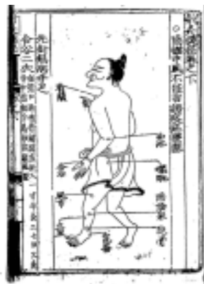
그림 9. 明代的针灸捷径.