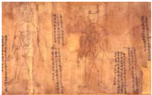
그림 5. 敦煌卷子. 小腸俞, 大小腸俞.

大肠输在十六椎两边相去一寸半。治风，腹中雷鸣，肠癖泄痢，食不消化，小腹绞痛，腰脊疼强，或大小便难，不能饮食，灸百壮，三日一报之(『千金要方·诸风』卷八)。