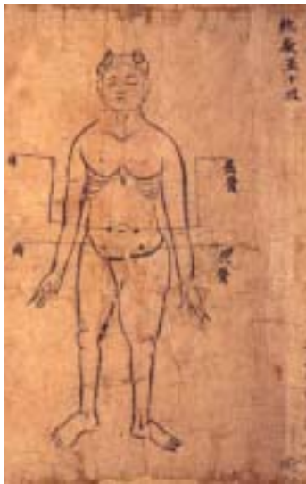
그림 1. 敦煌卷子. 屈骨, 横骨.

夹屈骨相去五寸名水道，主三焦，膀胱，肾中热气，随年壮(『千金翼方·针灸中』卷二十七)。