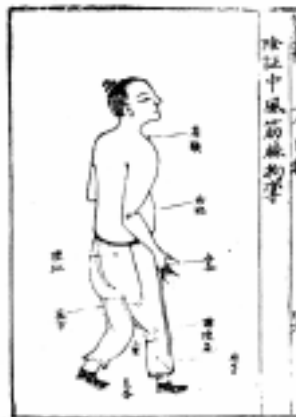
그림 10. 针灸全书.

第二, 由于此书所取之穴皆有文有图, 对于今人辨识“经脉穴”及某些“同名异穴”及“异名同穴”等疑难问题也提供了形象, 可靠的依据。例如现存灸方残卷共包含三个“经脉穴”: 手阳明, 足阳明, 足太阳, 由于此卷子穴图对于腧穴的具体部位有明确的标注, 一目了然, 从而对于“经脉穴”源流的考察提供了重要史料; 又如“天窗”既是颈部手太阳经穴穴名, 又是头部督脉穴“囟会”穴的别名, 以往由于不知此变故, 而将隋唐时期针灸方中头部督脉穴“天窗”都错误地理解成颈部手太阳经穴, 今依据卷子灸穴图, 并结合传世相关史料, 可以使得针灸史上这类疑难问题涣然冰释。