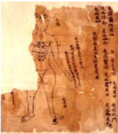
그림 6. 敦煌卷子. 天窗, 肩井, 風門, 肺俞.

癫狂二三十年者, 灸天窗, 次肩井, 次风门, 次肝俞, 次肾俞, 次手心主, 次曲池, 次足五趾, 次涌泉, 各五百壮, 日七壮(『千金翼方·针灸中』卷二十七).