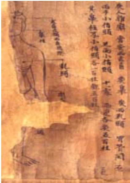
그림 4. 敦煌卷子. 玄角, 鼻柱, 乳头, 関原, 小指頭

值得注意的是，此方中“足阳明”，“手阳明”二穴，并非以往人们想当然地理解为经脉名称，而是经穴名，其部位皆相当于脉口处。其中“足阳明”穴，原方穴图虽残缺，但在另一图中确有清楚的标注(见图3)，相当于足阳明脉口——冲阳脉处。另该卷有三幅图均标注了“手阳明”穴名，均相当于手阳明脉口——阳溪穴处。