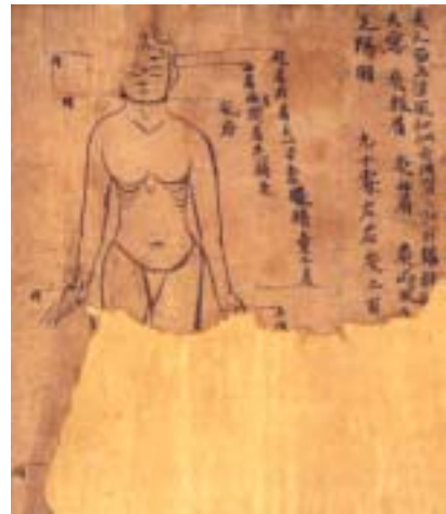
그림 2. 敦煌卷子. 板眉, 曲眉, 风府.

面上游风如虫行习习然，起则头旋眼暗，头中沟壑起，灸天窗，次两肩上一寸当瞳仁，次曲眉在两眉间，次手阳明，次足阳明，各灸二百壮(『千金翼方』)。