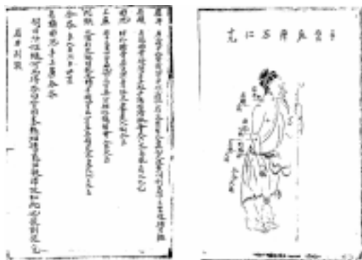
그림 8. 元代针灸集成的明初节录本.

第一, 敦煌卷子『佚名灸方』所录每一灸方下均据明堂文献详注其穴, 特别是该抄本每一灸方下皆附有灸穴图, 颇便于临床取穴。这种特殊的体例对后世的针灸方书的编纂也产生了一定的影响, 例如元代『针灸集成』的明初节录本(见图8), 明代的『针灸捷径』(见图9), 『针灸全书』(见图10)等皆用此例。