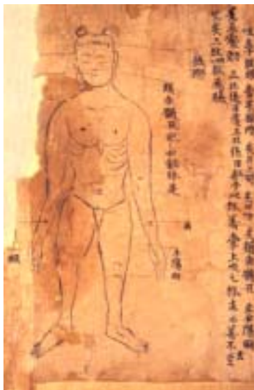
그림 11. 敦煌卷子. 頰車.

『佚名灸方』灸方除了敦煌卷子外, 只见于 『千金翼方』, 而后者注穴的规律是: 凡不见于 『明堂本经』的穴, 注其部位所在. 这与我们今天的规则相同: 只注经外奇穴和新穴的部位, 经穴部位则众人皆知而不出注. 可是敦煌残卷 『佚名灸方』的前后体例不统一, 有些图下详注腧穴的部位, 主治病症及灸疗法, 却不见相应的灸方. 因此不能排除这样的可能性: 敦煌残卷是两种文献, 一种是见于 『千金翼方』的不知名的灸方, 另一种见于 『千金要方』和 『千金翼方』的不知名的腧穴文献——灸经明堂.