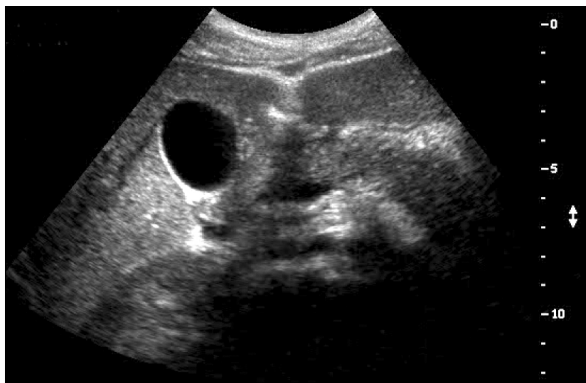
Fig. 2. Abdominal USG shows diffuse pancreatic swelling and scanty ascites around pancreas.

고, 또 하나는 췌액의 흡입에 사용하고, 남은 한 측공을 이용하여 Meditronic Synetics사의 수압펌프 장치로 분당 0.25 mm의 지속적인 물을 공급하면서 압력을 측정하였다. 도관을 주췌관에 삽입 후 pull-through technique으로 췌관에서 췌장괄약근을 거쳐 십이지장으로 빠지면서 압력을 측정하는 방식을 3회 되풀이 하였다. 측정되는 압력은 Synetics Polygram for Window (Synetics Medical AB, Stockholm, Sweden)을 이용하여 기록하였다.