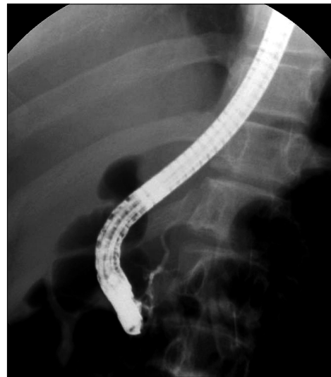
Fig. 3. The findings of endoscopic retrograde cholangiopancreatography. The main duct and side branches of pancreatic duct were normal without stricture or stone/tumor.