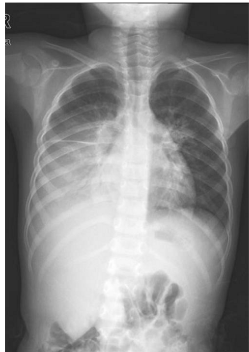
Fig. 1. Initial chest x-ray showed an extensive homogeneous consolidation with air-bronchogram involving the right lung with parahilar haziness in the left lung.

제2병일째 호흡곤란이 악화되어 중환자실로 전동하여 인공호흡기 치료를 시작하고 흉관을 삽입하였고, 항생제를 vancomycin과 cefotaxime으로 변경하였다. 중환자실로 전동될 당시 일반혈액검사상 혈색소 7.5 g/dL, 백혈구 2,330/mm 3 , 혈소판은 11,000/mm 3 로 전일에 비하여 빈혈과 혈소판감소증이 악화되어 적혈구와 혈소판 수혈을 시행하였다. 말초혈액도말검사에서 정구성, 소구성 빈혈 소견이었으며 변형적혈구증, 분열적혈구(schistocytes), 구상적혈구들이 관찰되었고 혈소판이 심하게 감소되어 있었다(Fig. 2). 혈액응고검사상 PT INR 1.21으로 정상범위, 섬유소원(fibrinogen)은 659 mg/dL로 증가되어 있었으며, 당시 검사한 혈액에 heparin이 섞여 있어 제7병일째에 확인한 aPTT는 35.6초로 정상이었