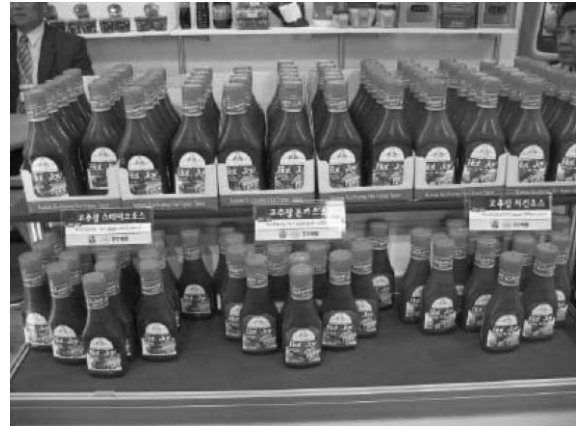
그림 2. 고추장 소스 생산 시제품.

C : BBQ 타입 : 고추장, 토마토, 우스터, hickory, 39 Brix, pH 3.36, 5.1% salt