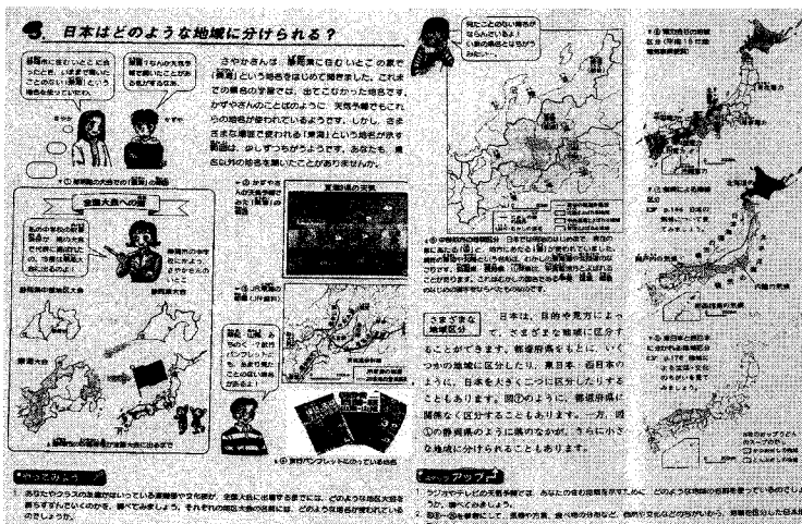
< 그림 5 > 일본의 지리 교과서 소단원 편성 형태