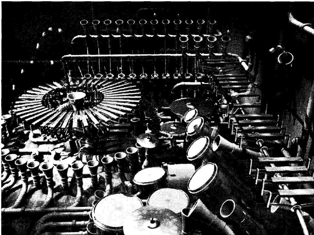
▶▶ 그림 1. http://www.animusic.com Pipe Dream의 한 장면

둘째로는 교육기관의 부재이다. 아무리 공부를 하고 싶어도 적합한 교재 및 교육기관이 없다. 미국에 대한 전문책이 5~6종(종합적인 책은 제외)이 있지만, 한국에는