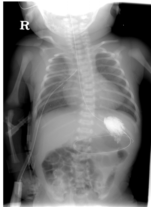
Fig. 3. Guide wire insertion through the proximal tracheoesophageal fistula after bronchoscopy