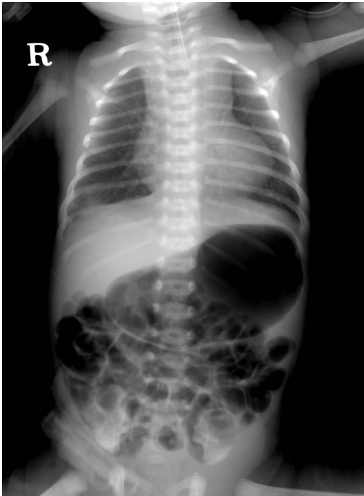
Fig. 1. Chest X-ray, showing the coiled orogastric tube in the proximal esophagus and stomach gas