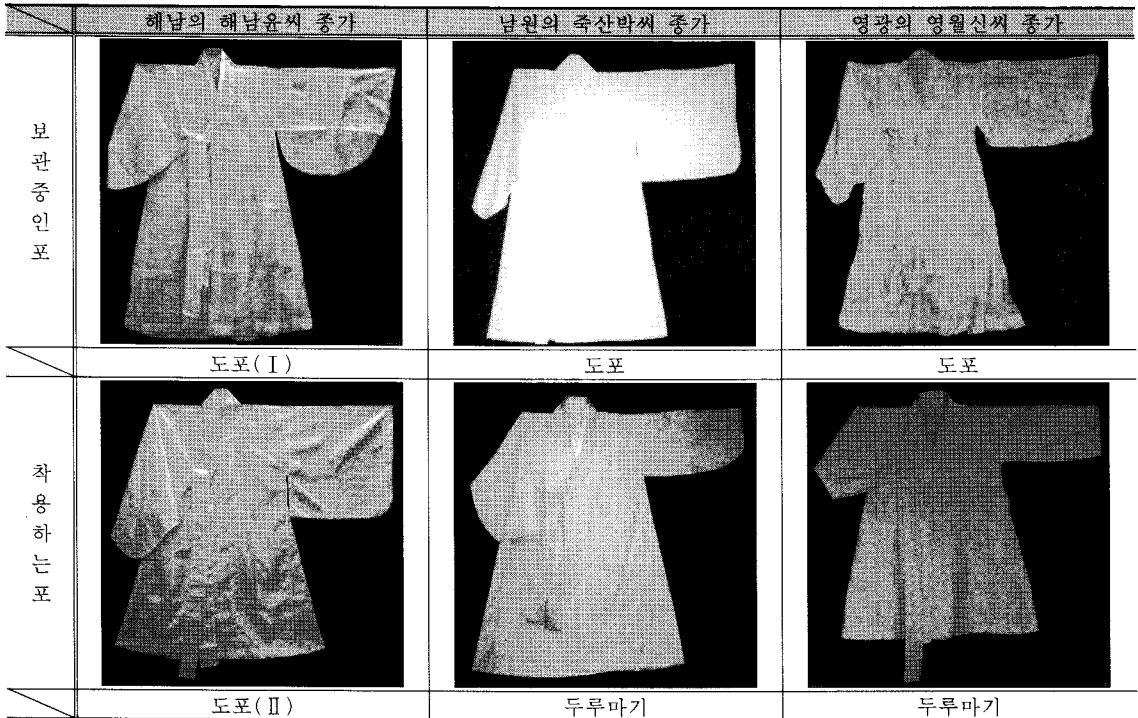
<표 5> 전라도 지역 종가의 제례복