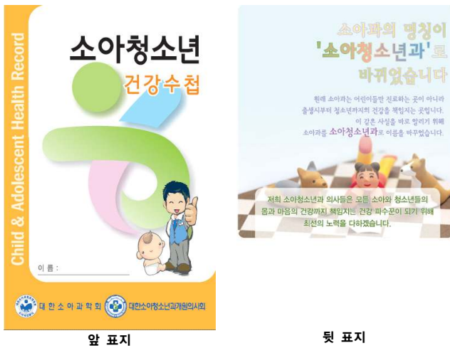
Fig. 1. Title and last pages of new edition of child and adolescent health record book.