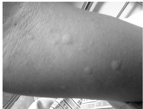
Fig. 3. View of Urticaria's Symptoms