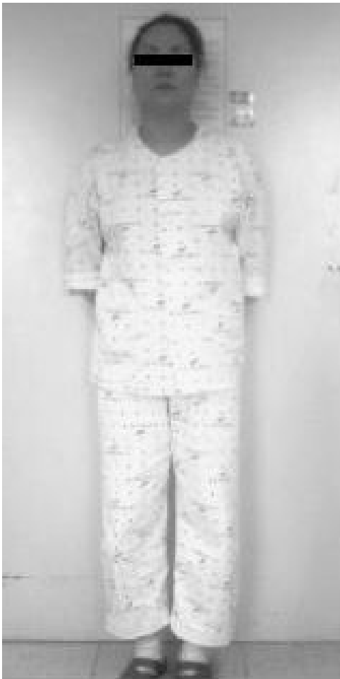
Fig. 1. Patient's Anterior View