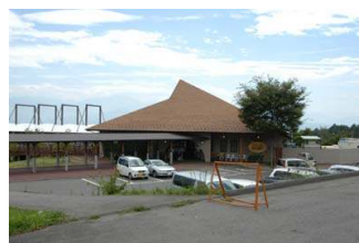
그림 5. 팜 레스토랑