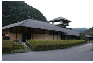
그림 7. 체험관