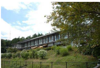
그림 4. 숙박시설(羽廣莊)