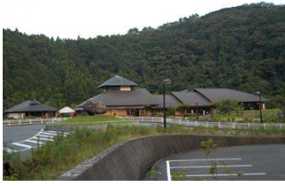
그림 6. 시설전경