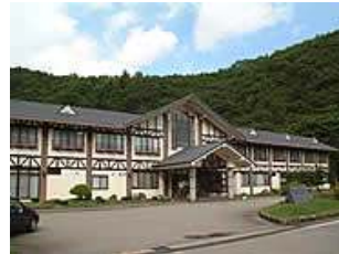
그림 11. 숙박시설

특산물과 농산물 직매소가 있는 「미치노에끼」와 레스토랑이 인접해 있고 장기 숙박시설, 체험시설(농산가공, 농원), 오토캠핑장 등이 있으며 각종 체험프로그램을 실시하고 있다. 이 시설의 연간 이용자수는 40만명 정도이고 연간 수입은 38억원이며 파스칼 키요미의 종업원수는 20명(정사원 13명)이다.