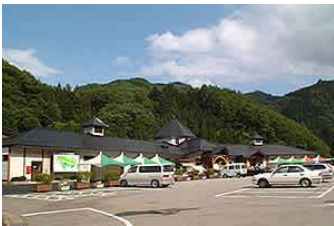
그림 10. 농산물 직매장