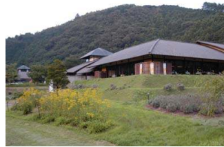
그림 9. 팜 레스토랑

개발이 미흡하며, 주차장과 숙박시설이 부족하며, 광역관광 네트워크 형성이 부족하다.