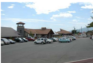
그림 2. 농산물직매장

입욕시설, 숙박시설, 스포츠시설, 레저시설에 인접해 있고, 관광농원(딸기 따기), 체험시설, 직매소 등을 설치한 교