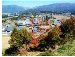
그림 12. 전원플라자카와바

카와바지역은 군마현 남부에 위치한 산촌마을이며 면적의 85%가 산림이 점하고 있고 농경지는 약6% 정도이며 인구는 4000명 전후로 39%의 주민이 제1산업에 종사하고 있다.