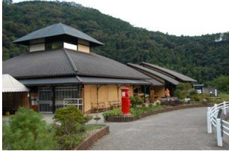
그림 8. 농산물 직매장