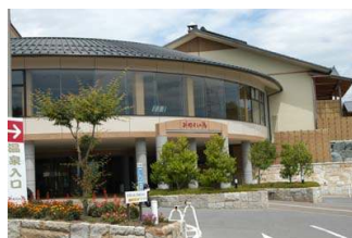
그림 3. 온천