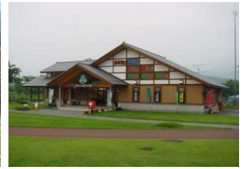
그림 13. 블루베리관

타 지역에 비해서 늦게 개발되어 시골풍경이 그대로 남아 있는 곳이 많아서 1981년 동경도 세타가야구와 상호협력협정을 체결하고 1986년에는 세타가야구민 건강촌이 개발되어 많은 사람들이 카와바에 찾아오게 되었다. 이것이 계기가 되어 세타가야구와 많은 교류사업을 시작하게 되었다. 교류사업으로는 ① 사과나무분양사업, ② 和紙造形大學, ③ 게이트볼 교류, ④ 학교자매결연 교류, ⑤ 우호의 숲 사업이 있고, 그 외에도 모밀국수 만들기 모임, 당일 버스 견학회, 향토음식 배송사업, 武尊山등산, 플라워 낚시회, 구민 건강촌 모임, 야외 교실 등의 도농교류사업이 있다.