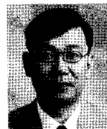
한국외국어대학교 졸업(학사), 영국 Manchester 대학(석사), 영국 Sussex 대학교(과학기술정책학 박사), 한국전자통신연구원 기술정책팀장 현재 한국정보통신대학교(CU) 경영전문대학원 교수 관심분야: 과학기술정책, 기술혁신 이론, 기술경영