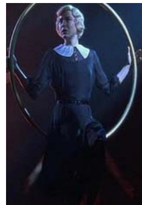
<그림 7> 결백을 상징하는 흰색 칼라 -영화<시카고(2002)>, DVD