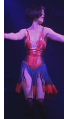
<그림 16> 빨간색과 파란색의 프린징 드레스 - 영화<시카고(2002)>, DVD