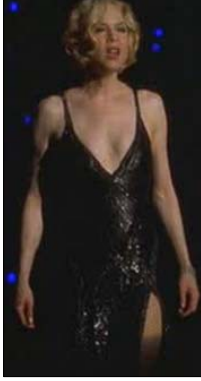
<그림 8> 암울한 특시의 검은색 롱 비즈 드레스 - 영화<시카고(2002)>, DVD