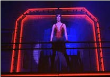
<그림 19> 열정의 빨간색과 우울한 심리와 자유를 갈망하는 파란색 배경의 'The Desperation' 무대 -영화<시카고(2002)>, DVD