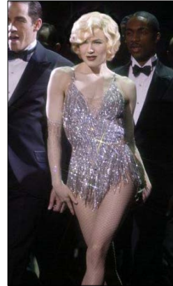
<그림 5> 자기도취에 빠진 특시의 화려한 비즈드레스 -영화<시카고(2002)>, DVD