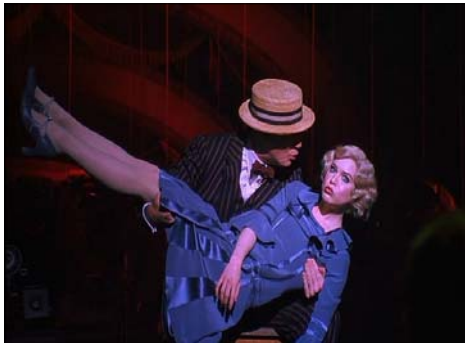
<그림 4> 로 웨이스트라인의 파란색 원피스 드레스 -영화<시카고(2002)>, DVD