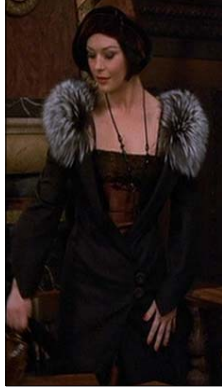
<그림 17> 모피장식의 랩코트 -영화<시카고(2002)>, DVD