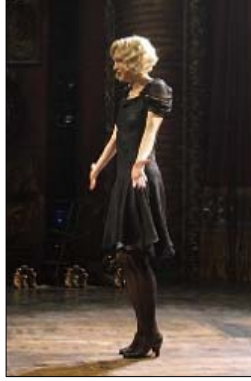
<그림 9> 검은색 로 웨이스트 원피스 드레스 - 영화<시카고(2002)>, DVD