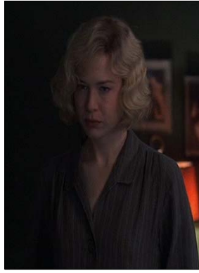
<그림 2> 회색의 죄수복 -영화<시카고(2002)>, DVD