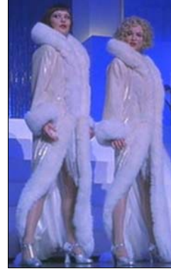
<그림 10> 모피장식의 흰색 롱 코트 - 영화<시카고(2002)>, DVD