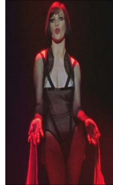
<그림 13> 검은색 바디슈트와 대비되는 빨간색 손수건 - 영화<시카고(2002)>, DVD