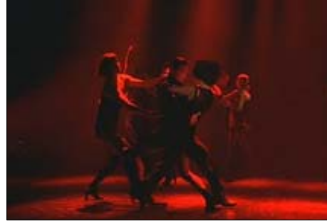
<그림 18> 증오, 분노와 살인을 상징하는 검은색과 빨간색의 'Cell Block Tango' 무대 -영화<시카고(2002)>, DVD