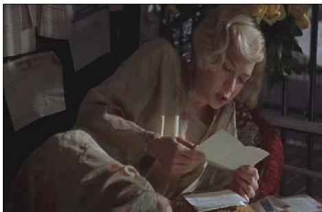
<그림 6> 꽃무늬의 밝은 색상의 가운 -영화<시카고(2002)>, DVD