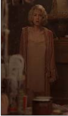
<그림 1> 살색의 파스텔색 슬립과 가운 -영화<시카고(2002)>, DVD