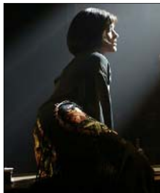
<그림 15> 어두운 검은색 가운 - 영화<시카고(2002)>, DVD