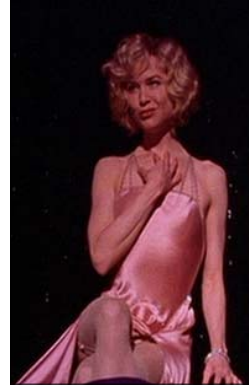
<그림 3> 환상 속 분홍색 새틴 드레스 -영화<시카고(2002)>, DVD