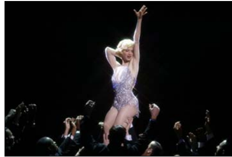
<그림 20> 관심의 집중, 에로티시즘을 상징하는 검은색 배경의 'Roxie' 무대 -영화<시카고(2002)>, DVD