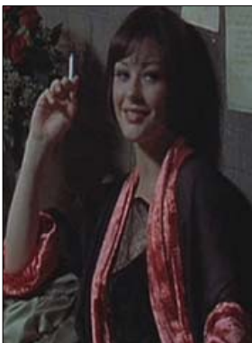
<그림 14> 검은색 가운, 빨간색 소맷부리와 깃 - 영화<시카고(2002)>, DVD