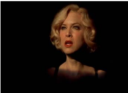
<그림 21> 절망, 암울한 현실을 나타내는 검은색 배경의 작별무대 -영화<시카고(2002)>, DVD