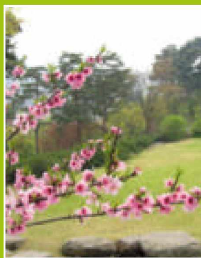
표지사진 '호암미술관정원'