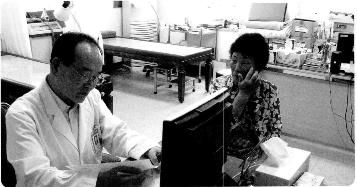
▲ 광주·전남 지부는 기초생활수급권자, 일반주민 등 1,100 여 명에게 무료건강검진을 실시하였다.

한국건강관리협회는 봉사과 희생을 실천하고 있습니다. 지난 9월 한 달 동안에도 1만7백여 명에게 무료건강검진과 건강상담을 실시하여 아름다운 만남을 실천하였습니다.