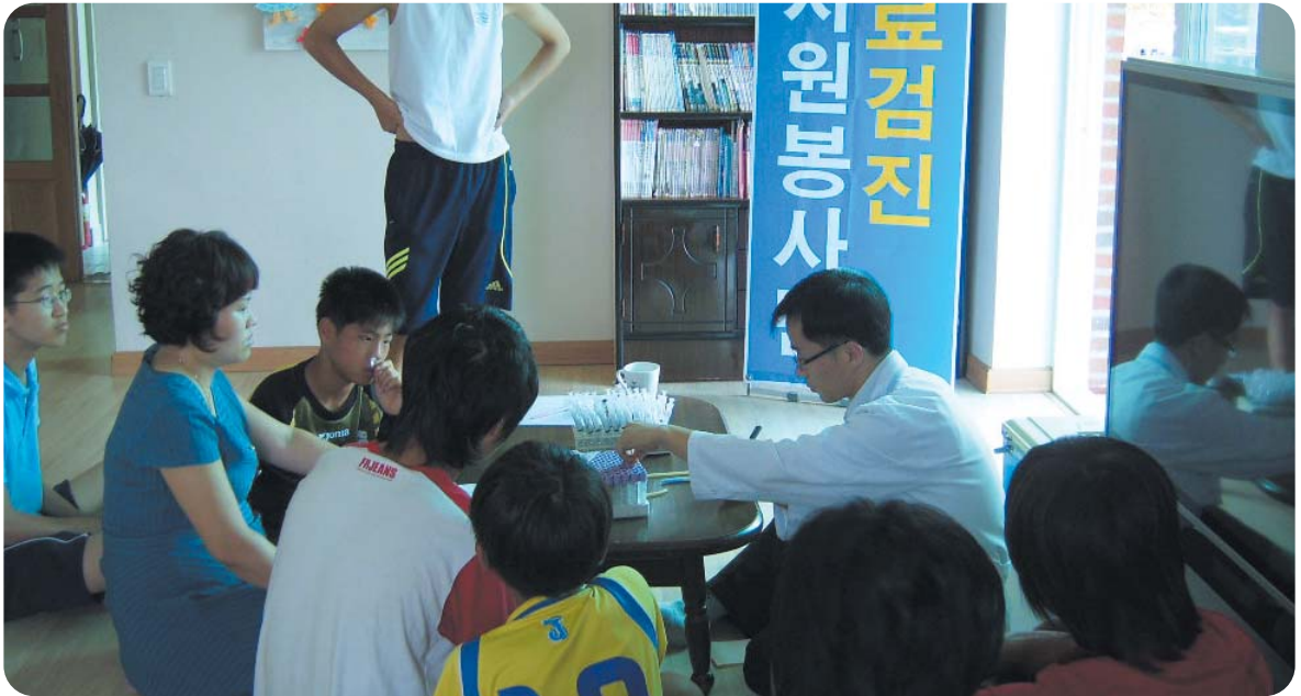
▲ 충북지부는 아동복지시설 생활자, 일반주민 등 650여 명에게 무료건강검진을 실시하였다.

한국건강관리협회는 봉사와 희생을 실천하고 있습니다. 지난 8월 한 달 동안에도 8천여 명에게 무료건강검진과 건강상담을 실시하여 아름다운 만남을 실천하였습니다.