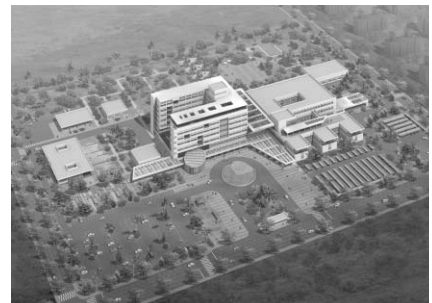
명승건축 베트남병원 조감도